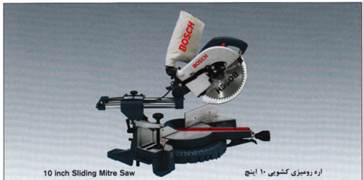
10 inch Sliding Mitre Saw