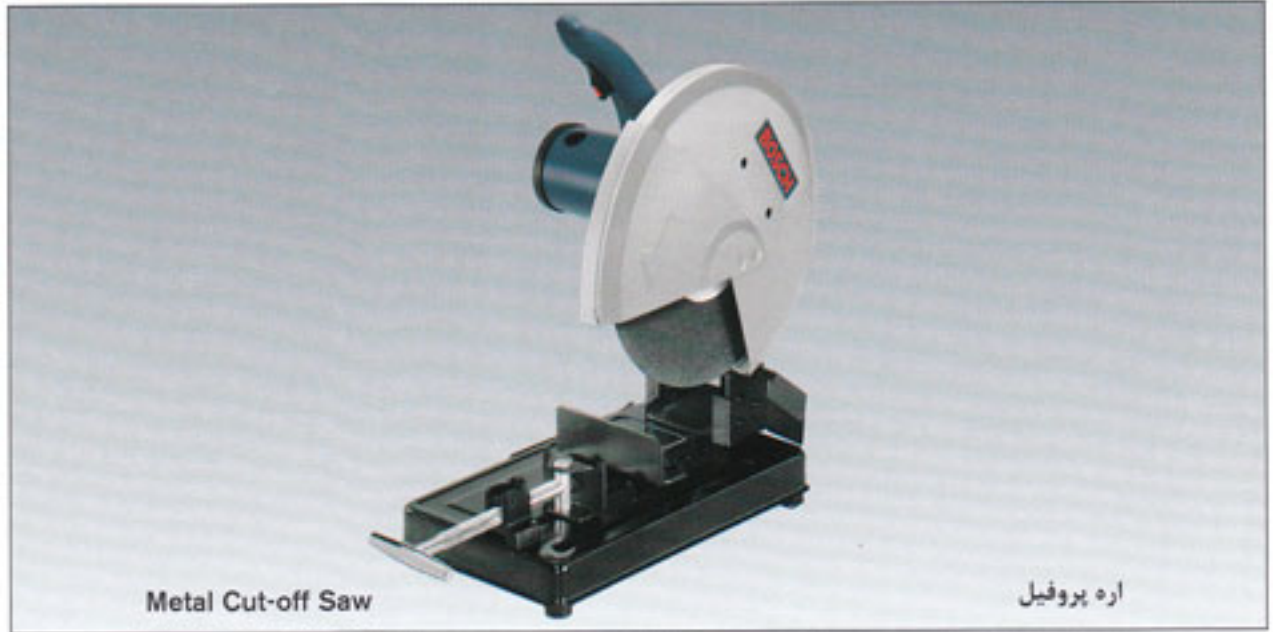
Metal Cut-off Saw