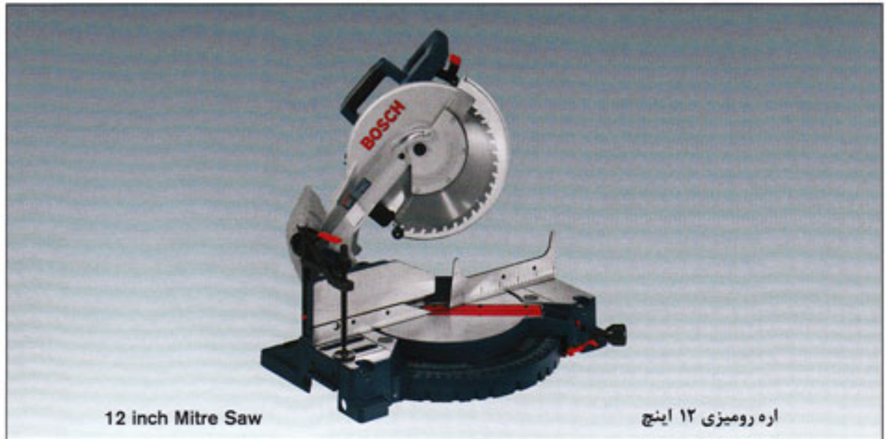
12 inch Mitre Saw