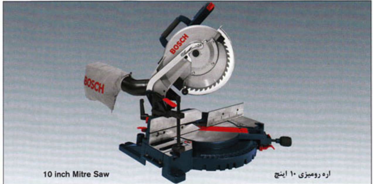
10 inch Mitre Saw