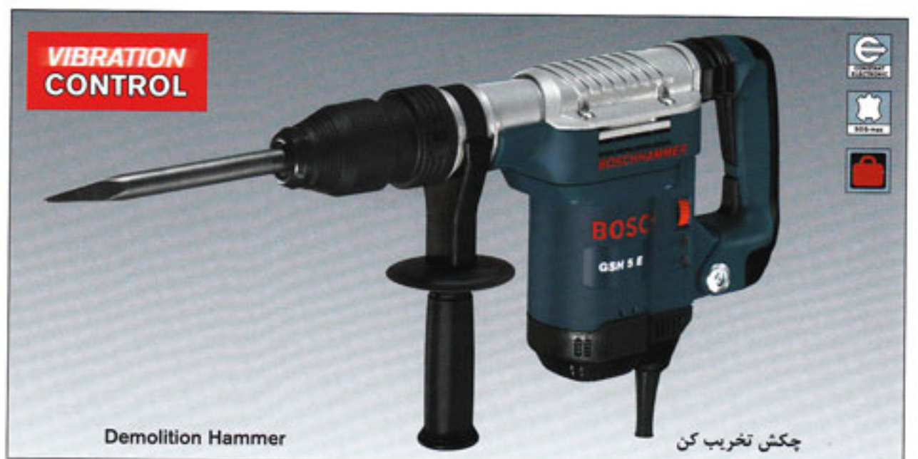
GSH 5 E PROFESSIONAL