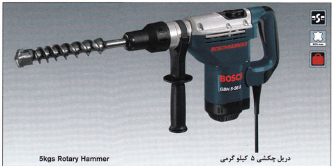
5kgs Rotary Hammer