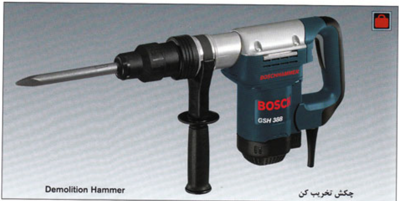
GSH 388 PROFESSIONAL