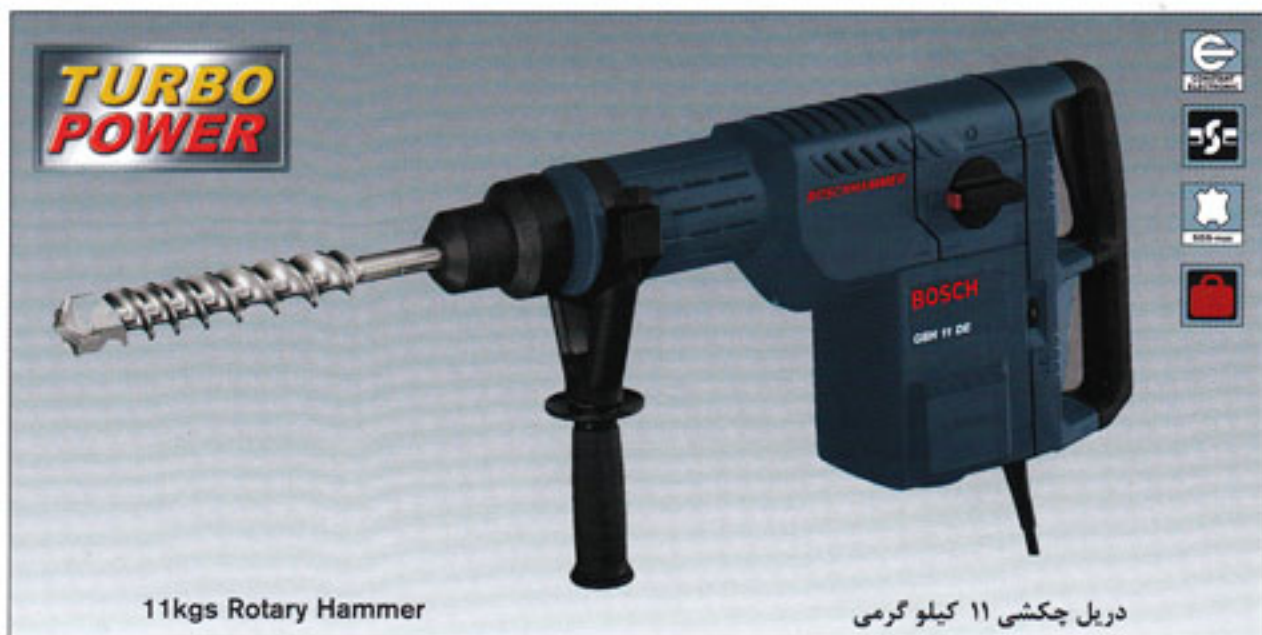
11kgs Rotary Hammer