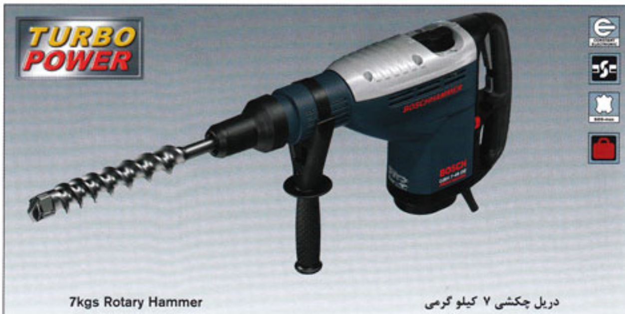
7kgs Rotary Hammer