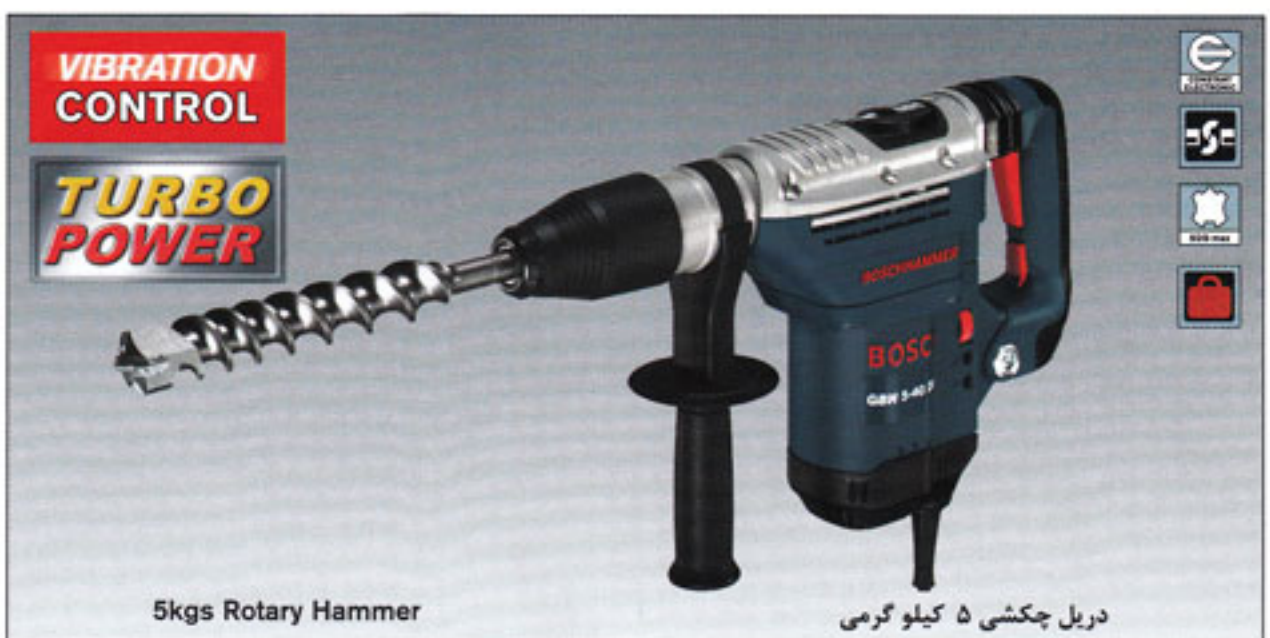
5kgs Rotary Hammer