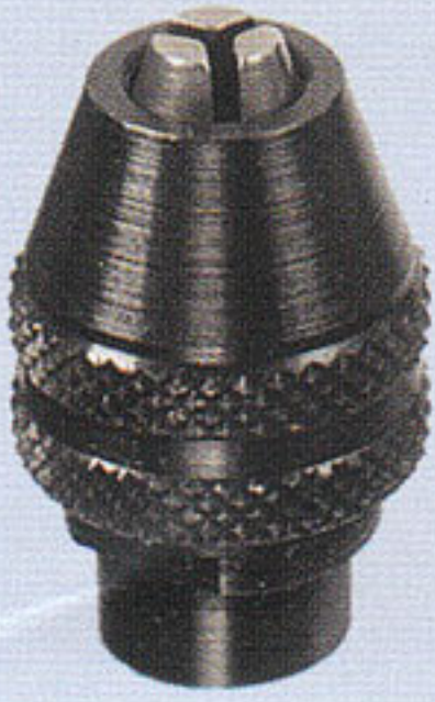
سه نظام چند منظوره 2615448632