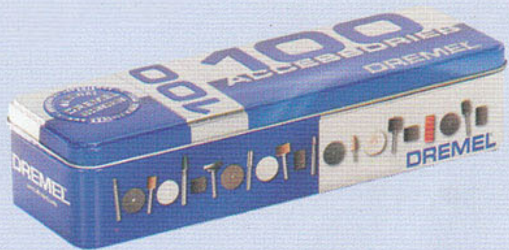
ست ۱۰۰ تایی 26150701JA