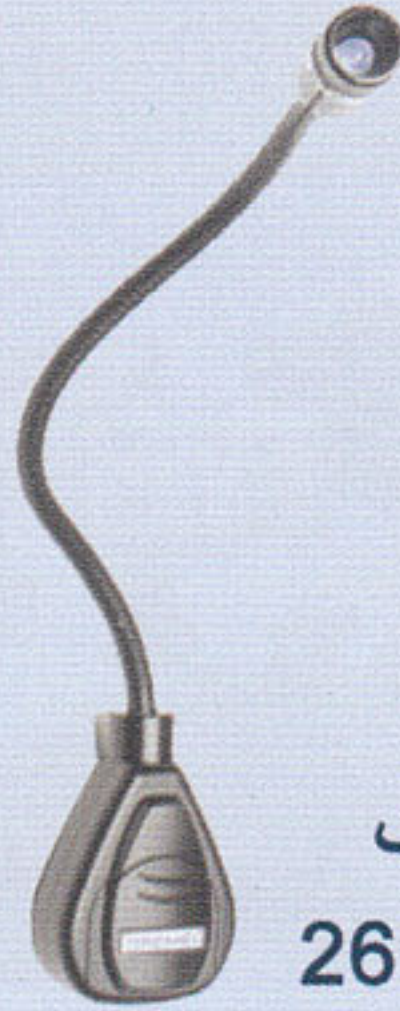
چراغ متحرک 26150DL4JA