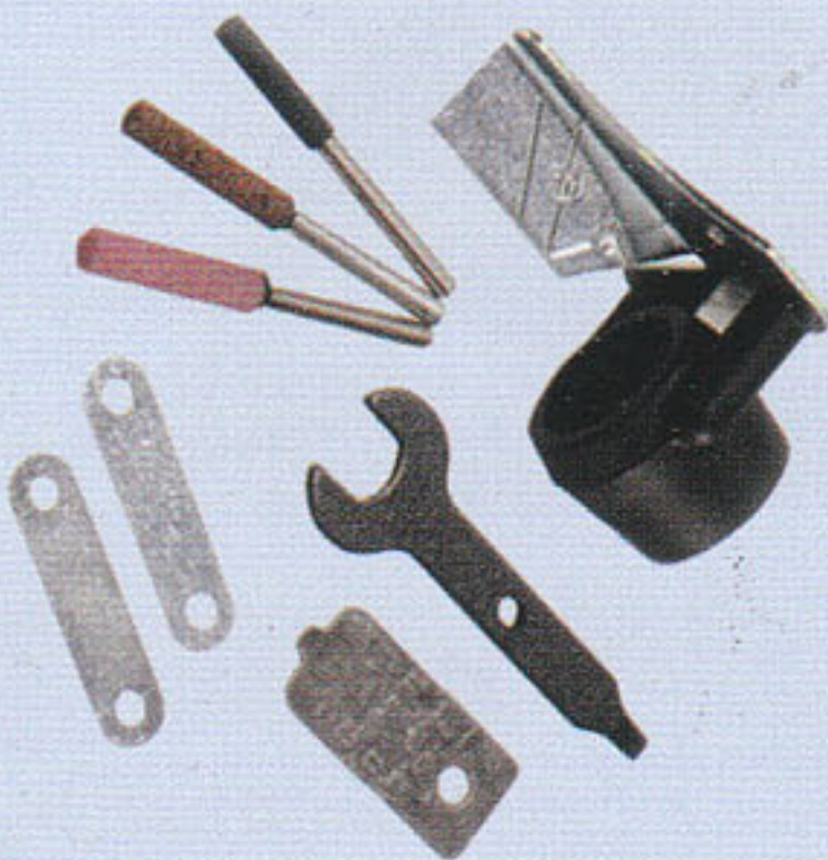
تیز کننده تیغه اره زنجیری 26151453PA