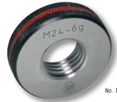
No. 1205 1..

1205 1.. : NO-GO thread ring gauge 6g (<M1.6 - 6h)