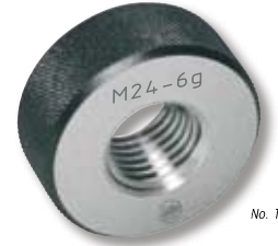
No. 1204 1..

1204 1.. : GO thread ring gauge 6g (<M1.6 - 6h)