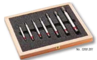
No. 1200 201

1205 201 : NO-GO thread ring gauge 6g set