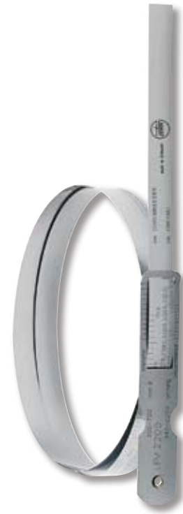
No. 5285 102